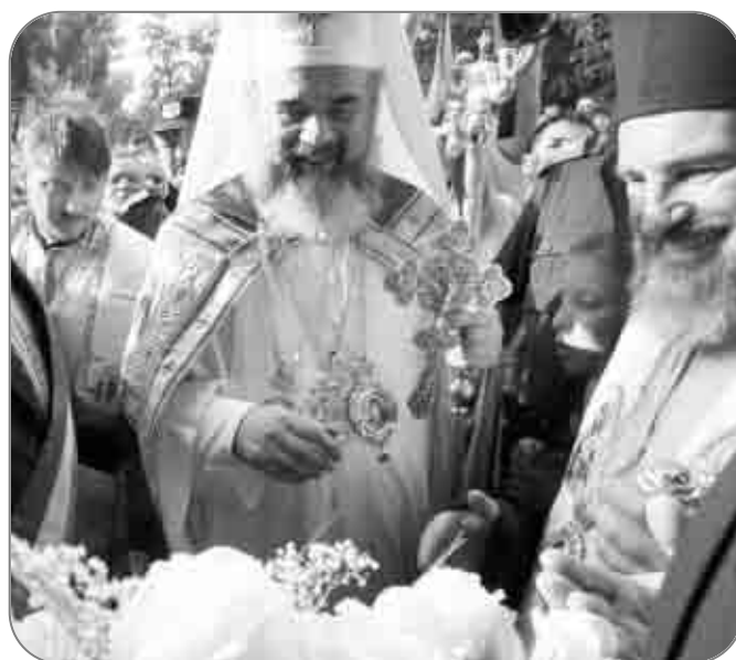
Prezent anul trecut la Roman, cu prilejul ridicării eparhiei noastre la rangul de arhiepiscopie, PF Părinte Patriarh Daniel a fost întâmpinat cu toată dragostea de către ierarhii, preoții și credincioșii locului

Patriarhul Bisericii noastre a fondat mai multe publicații și a participat la peste 100 de simpozioane, congrese, conferințe, colocvii și întruniri naționale și internaționale, fiind, de asemenea, autorul mai multor volume de scrieri. A publicat peste 1.000 de articole, studii, cuvântări și prefete, atât în română, cât și în limbile franceză, engleză și germană.