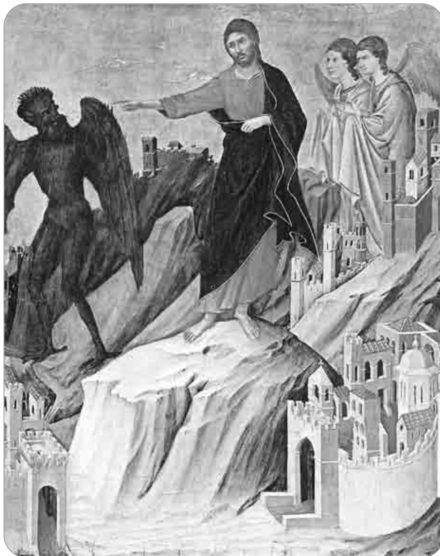
Ispitirea de pe Munte, icoană pe lemn, 1308-1311

Așadar, nu trebuie să definim răul, nici să-i scrutăm originile, ci să luptăm, ca și Iisus, împotriva lui, în toate zilele vieții noastre, până ce Hristos ne va primi în Împărăția Sa și ne va răsplăti cu bunătățile cele veșnice pentru că am fost capabili să luptăm contra dușmanului Binelui. Această luptă continuă și tensionată cu toate ipostazele răului coincide cu parcurgerea drumului spre nepătimire, mai întâi ca o coborâre spre străfundurile și tenebrele ființei noastre, întru identificarea omului ascuns al inimii, pentru ca, de acolo, să urcăm spre „partea cea de-a dreapta a inimii“, unde locuiește Dumnezeu și unde se află harul Botezului, care să ne îmbrace în haina neîntinată a Împărăției. Numai în felul acesta setea de Absolut ne va fi potolită și unirea noastră cu Dumnezeu va însemna o continuă sorbire din Potirul neseecat al coastei rănite a Mântuitorului înviat. ■