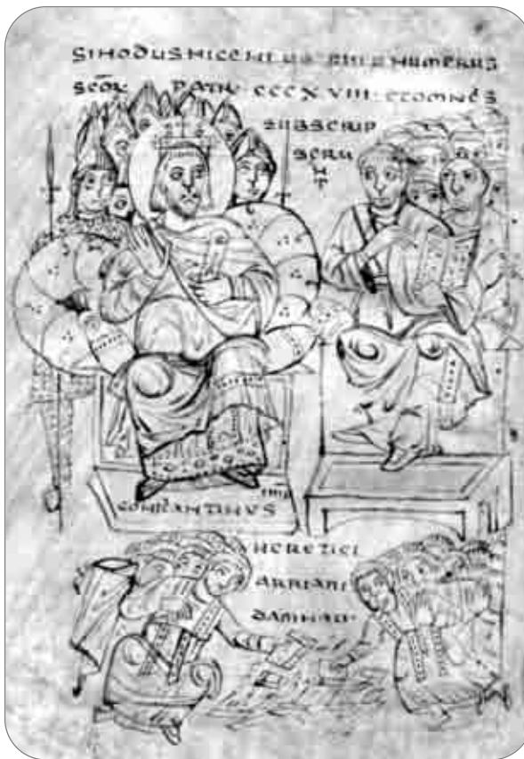
Arderea cărților ariene de către Sf. Constantin cel Mare și Sfinții Părinți participanți la Sinodul I Ecumenic de la Niceea (ilustrație dintr-un compendiu de drept canonic din Nordul Italiei, datat cu aproximație la anul 825)

mântuire S-a pogorât din ceruri și S-a întrupat și S-a făcut om și a suferit și a înviat a treia zi: S-a suit la cer și va veni ca să judece pe cei ce trăiesc și pe cei morți. Credem și în Duhul Sfânt. Iar pe cei care spun că: a fost un timp când nu era, că a fost înainte de a fi născut, precum că a fost din cele ce nu există, sau că este dintr-un ipostas, sau substanță, sau zic că Fiul lui Dumnezeu este schimbător și nu mereu aceleași, Sfânta Biserică Sobornicească și Apostolică îi Anatematizează“ (Cf. Scrisoarea episcopului Eusebiu de Cezareea către Biserica din Cezareea Palestinei, la Teodoret de Cyr, Istoria bisericească, I, 12). Simbolul de credință niceean, fiind astfel formulat, trebuia să fie întărit cu semnăturile episcopale ale ierarhilor prezenți Sfântul Constantin a decis ca toți cei care nu vor subscrie acestui însemnat document, să fie exilați, indiferent de treapta clericală pe care o dețineau. Toți Părinții Sinodului au semnat Simbolul, cu excepția lui Arie și a episcopilor Secundus de Polemida și Theonas de Marmarica. Până la final, au semnat și episcopii Eusebiu de Nicomidia, Teognis de Niceea și Maris de Calcedon, care au încercat să se sustragă,