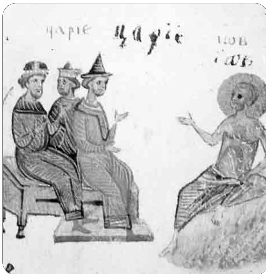
În Cartea Iov, din Vechiul Testament, câțiva prieteni vin să-l vadă pe Iov în suferința lui și încearcă să-i explice câteva teorii ale influenței răului (miniatură dintr-o Psaltire kieviană, 1397)

Trebuie oare să luptăm împotriva răului toată viața? Da, căci Dumnezeu luptă permanent, în noi și cu noi, contra răului. Nu trebuie să slăbim nicicum luptând, întru libertatea noastră, prin El, împotriva puterilor infernale din