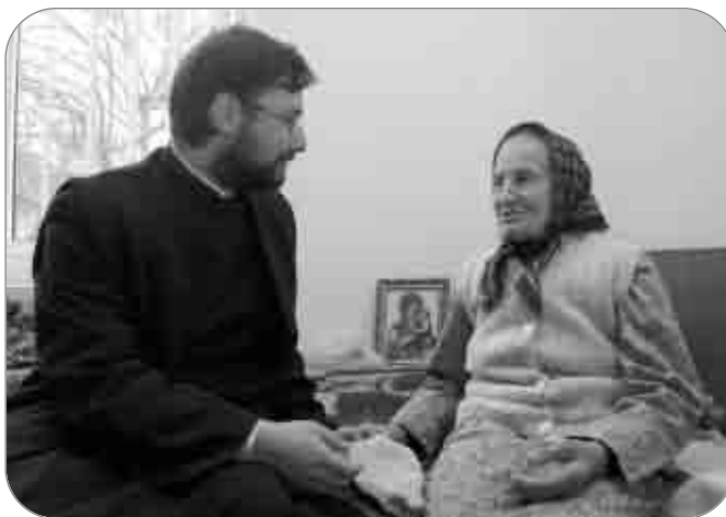
La Așezământul de la Hârja, aproape 30 de bătrâni sunt îngrijiți și asistați spiritual în fiecare zi