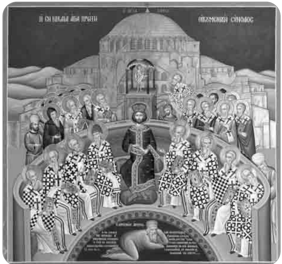
Sinodul I Ecumenic de la Niceea

În esență, acestea sunt formulări rezumative dogmatice, cum reiese din textul: Cu adevărat mare este taina drepte credințe: „Și cu adevărat, mare este taina drepte credințe: Dumnezeu S-a arătat în trup, S-a îndreptat în Duhul, a fost văzut de îngeri, S-a propovăduit între neamuri, a fost crezut în lume, S-a înălțat întru slavă.“ (I Timotei 3, 16). Mai găsim și alte scurte definiții de credință: „Harul Domnului nostru Iisus Hristos și dragostea lui Dumnezeu și împărtășirea Sfântului Duh să fie cu voi cu toți!“ (II Corinteni 13, 13) și „Căci trei sunt care mărturisesc în cer: Tatăl, Cuvântul și Sfântul Duh, și Acești trei Una sunt.“ (I Ioan 5, 7). Trebuie să cunoaștem că aceste formulări rezumative au fost utilizate de Biserică, de la începuturile ei, ca „reguli“ sau îndreptare de credință, mărturisirile de nofiți la primirea Botezului. În Biserica primară Botezul este administrat în prima săptămână