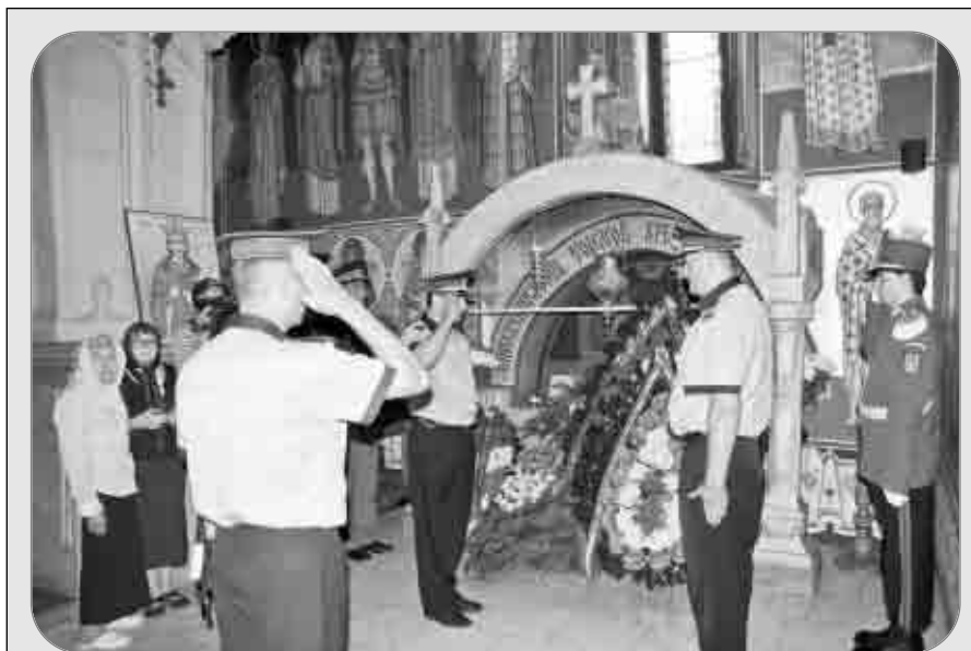
Jandarmeria Română și Poliția de Frontieră au adus un omagiu prin depunerea de coroane de flori la mormântul Sfântului Voievod și prin intonarea Imnului de Stat

În acest sens, pomind de la cele consemnate de cronicarul Grigore Ureche: „... ce după moartea lui, până astăzi îi zice sveci (sfântul) Ștefan Vodă, nu pentru sufletu, ce este în mâna lui Dumnezeu..., ci pentru lucrurile lui cele vitejești, carile nimenea din domni, nici mai înainte, nici după aceea l-au ajuns“ și continuând cu N. Iorga care îl caracteriza pe Ștefan cel Mare ca fiind „un om minunat, un sfânt cum nu mai poate răsări altul, izvorul a toată vitejia, fântâna tuturor drep-