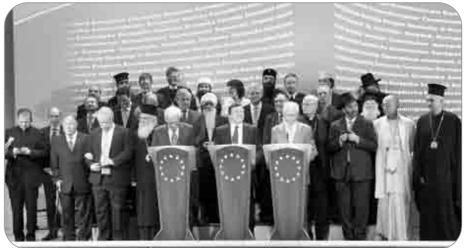
Contribuția deosebită a Bisericilor în lupta contra sărăciei și a excluziunii sociale a fost salutată de cei trei președinți ai principalelor instituții europene