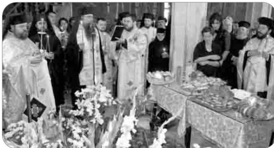
Trisaghion la mormântul patriarhului Teoctist

În acest context a fost citit mesajul Preafericitului Părinte Daniel, Patriarhul Bisericii Ortodoxe Române, cu ocazia comemorării a trei ani de la trecerea la cele veșnice a părintelui patriarh Teoctist Arăpașu, intitulat „Patriarhul Teoctist - o candelă de înviere“. După Slujba Parastasului a fost oficiat un Trisaghion la mor-