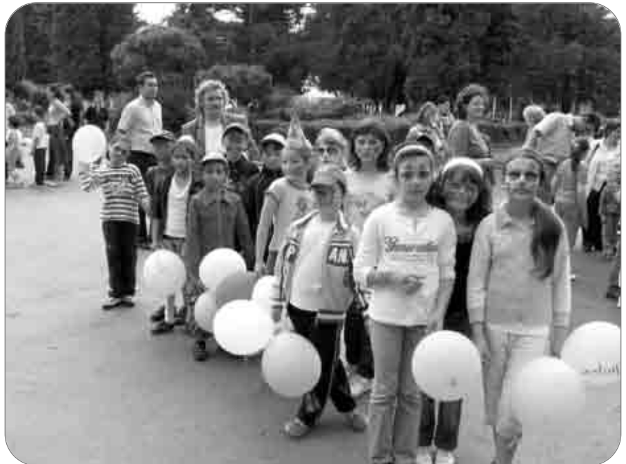
Copiii Centrului de zi „Episcop Melchisedec“, beneficiari ai proiectului „Zămbete colorate“, în ziua de 1 iunie 2010

Anul 2009 a fost un an plin de activități și de reușite, în care copiii au beneficiat de instruire adecvată, de excursii și tabere de formare. În cursul anului școlar 2009 - 2010, copiii beneficiari ai proiectului s-au bucurat atât de hrana oferită, cât și de participarea la trei proiecte educative, alături de tinerii din Clubul Impact