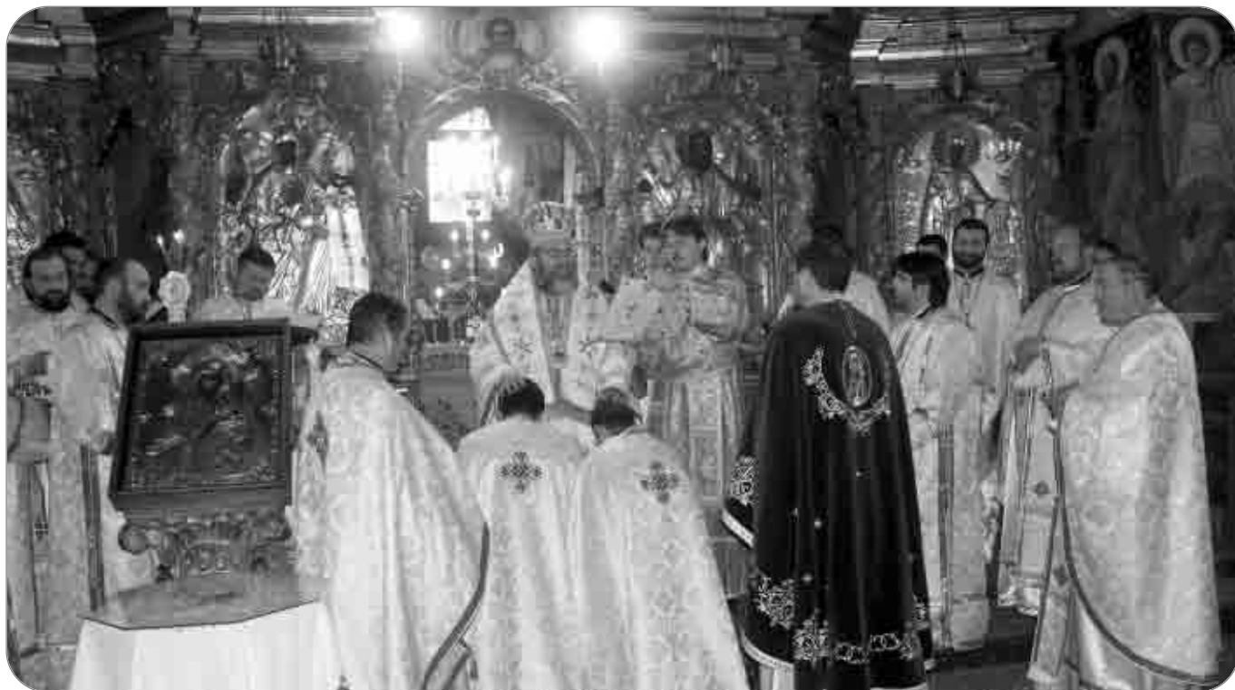
Taina Spovedaniei este săvârșită numai de persoanele care primesc calitatea de duhovnic. Această calitate se obține prin hirotesia oficială de un ierarh

citează în Evanghelia sa, înainte ca Hristos să cheme la pocăință: „Poporul care stătea întru întuneric a văzut lumină mare, și celor ce ședea în latura și în umbra morții lumină le-a răsărit” (Matei 4, 16). Pocăința este deci o iluminare, o trecere de la întuneric la lumină. A te pocăi înseamnă, în acest context, a deschide ochii razelor luminii dumnezeiești, a nu rămâne