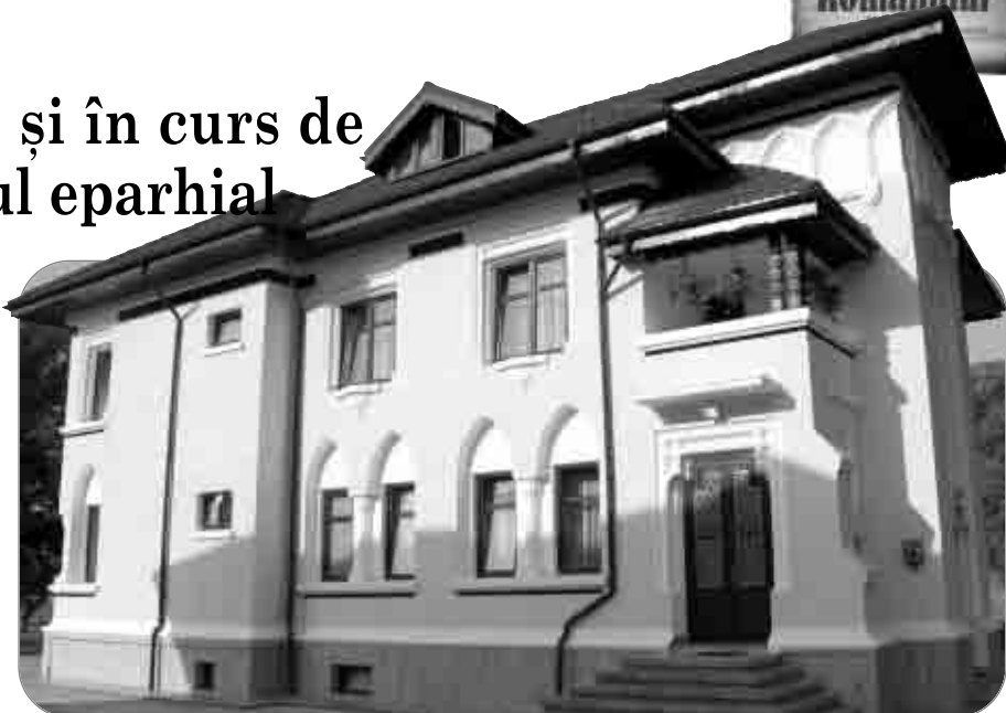
Una dintre cele două vile „Episcop Lucian Triteanu“, din incinta Centrului eparhial de la Roman

În cursul anului trecut la Centrul eparhial s-au finalizat lucrările de renovare a vilelor „Episcop Lucian Triteanu“, lucrare care a avut