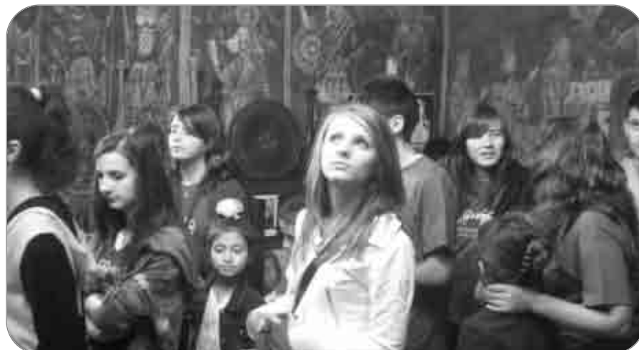
Copiii de la Centrul de zi „Episcop Melchisedec”, în excursie la Mănăstirea Humor (22 iunie 2010)