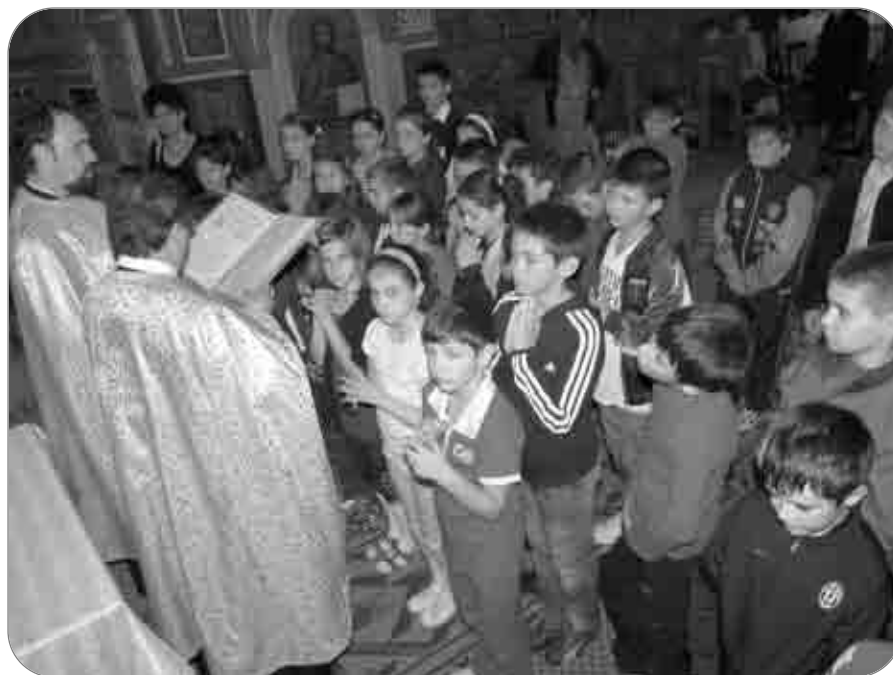
Beneficiarii serviciilor oferite de Cantina „Samarineanul milostiv”, primind binecuvântarea lui Dumnezeu de ziua lor, 1 iunie 2010