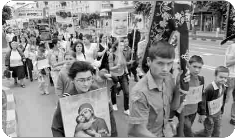
Copiii au participat de 1 iunie la Marșul Vieții

Tot de Ziua Copilului, la Centrul de zi „Sf. Ioan Botezătorul” al Fundației „Episcop Mel-