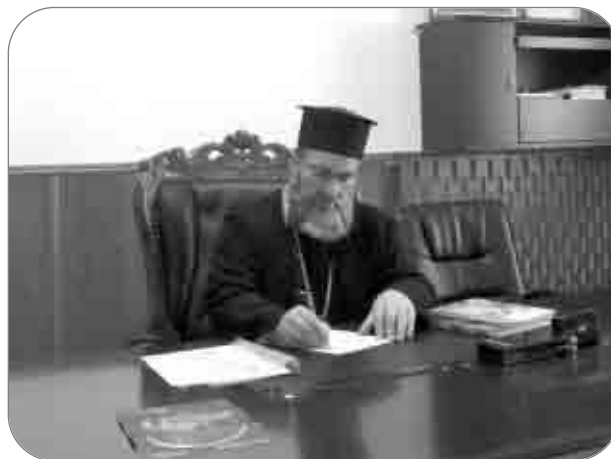
PS Părinte Episcop Ioachim Băcăuanul, membru în Comisia liturgică a Sfântului Sinod al BOR, a alcătuit, până în prezent, slujbele a 20 de sfinți români

În cele ce urmează, într-un interviu acordat pentru publicațiile Lumina, ale Patriarhiei Române, Preasfințitul Ioachim Băcăuanul, Episcop-vicar al Arhiepiscopiei Romanului și Bacăului, explică semnificațiile Duminicii închinată Tuturor Sfinților Români, precum și condițiile care trebuie îndeplinite la canonizarea unui sfânt.